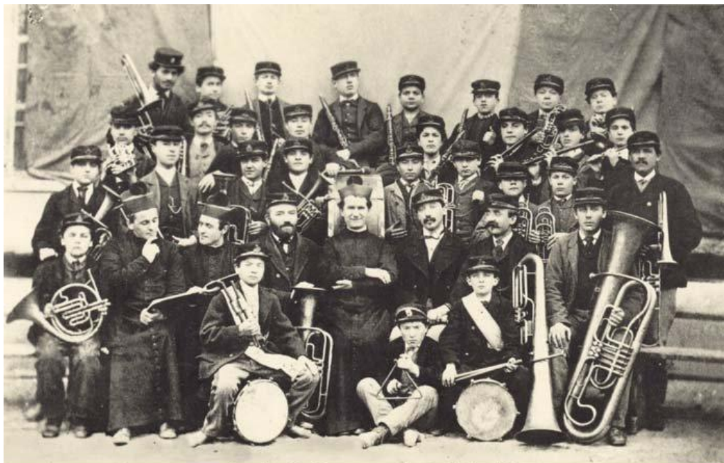
Anonimo, Don Bosco con orchestra, Torino, 1870

"Un oratorio senza musica è come un corpo senza anima."